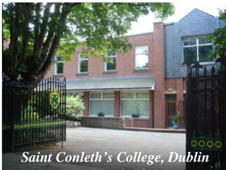
Saint Conleth's College, Dublin

La formule proposée est unique en ce sens qu'elle se rapproche d'un échange individuel avec tous les bénéfices y afférant – mais sans obligation de réciprocité.