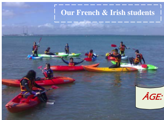
Our French & Irish students